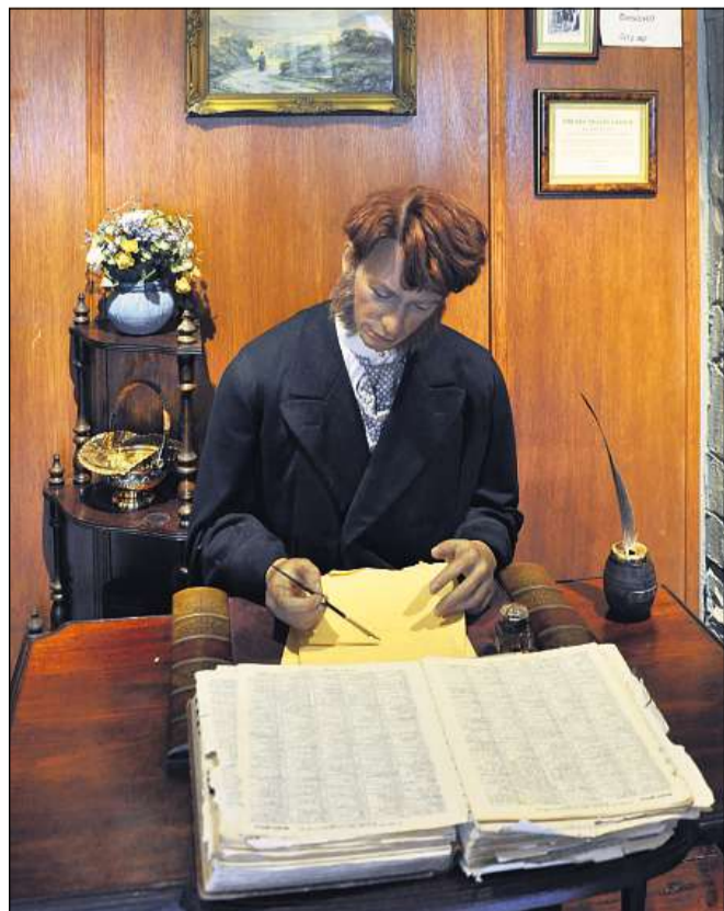
Scena or da «La Lia dals chaus cotschens» en il Museum da Sherlock Holmes a Londra.

chatta.ch/?id=1337&chiid=2870 www.chatta.ch